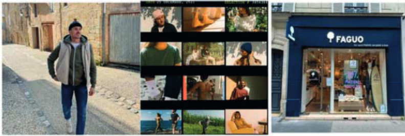
Figure 9. Photographies « naturelles » publiées sur les 3 comptes Instagram

Cette analyse, qui met en exergue la réappropriation sélective du récit de la sobriété heureuse par les marques de mode dite responsable, nous conduit à discuter de la notion d'encastrement de la communication environnementale et de la communication marchande.