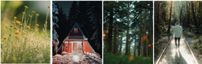
Figure 5. Photographies « professionnelles » d'espaces naturels

La « sobriété heureuse » suppose une modération de la consommation et en même temps, « relève résolument du domaine mystique et spirituel 24 ». Elle vise à créer un « espace de liberté, affranchi des tourments dont nous accable la pesanteur de notre propre existence 25 ». Cet espace est évoqué sur les comptes Instagram par des invitations à la contemplation dans les messages qualifiés d'« inspirationnels » (professionnels 1, 3, 5) mettant en scène des paysages urbains ou naturels selon les esthétiques des photographies « professionnelles 26 » typiques d'Instagram (Manovich, 2020).