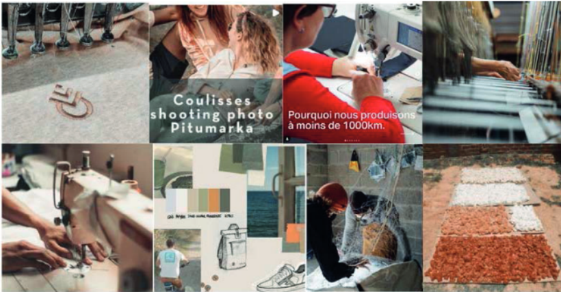
Figure 8. « Images-coulisses »

« Pour tout ce qui est éthique, pour moi, c'est voir de l'humain, voir du concret, voir les artisanes qui tissent, qui font du tissage » (professionnel 2).