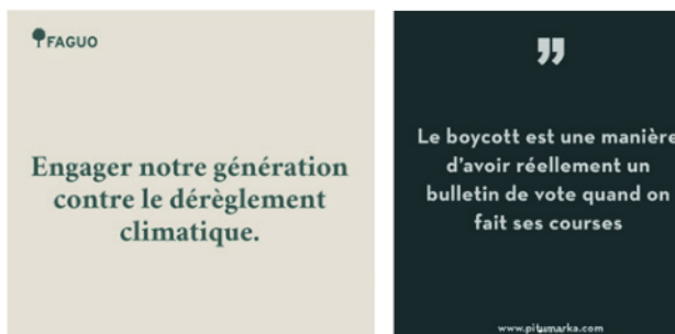
Figure 7. L'évocation de visuels propre au champ politique [@Faguo]. 20/03/2022 et [@Piturmarka]. (18/12/2020)

Les marques étudiées dénoncent la fast fashion , en mobilisant le champ lexical du militantisme politique (« Boycott », @Piturmarka, 18/12/2020, « Fashion Revolution week » (professionnel 6), « nous tenons à conserver notre liberté » [@Hopaal_] (22/08/2022)). Sur les comptes de Hopaal_ et de Faguo, on trouve des références aux campagnes pour l'élection présidentielle 2022, incriminant le manque d'engagement politique vis-à-vis du climat. D'autres images reprennent les codes visuels et textuels (slogan épuré sur fond neutre) des campagnes politiques (Fig. 7). Des figures de la contestation sociale,