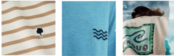
Figure 6. Visuels associant symboles liés à la nature et marques

L'alternance d'images présentant les produits et des paysages renvoie non seulement à l'idée que les composants sont d'origine naturelle, mais aussi que la marque favorise une telle (re-)connexion avec la nature. Telle est la proposition de Faguo : « créer un vestiaire qui permet de vivre aussi bien au coeur de la ville qu'en pleine forêt » [@Faguo]. (21/01/2022). Certains visuels (Fig. 6) suggèrent aussi sur le plan sémiotique que la nature est incorporée aux produits, idée renforcée par les commentaires qui rappellent l'origine naturelle des composants (coquilles d'huîtres, coton biologique).