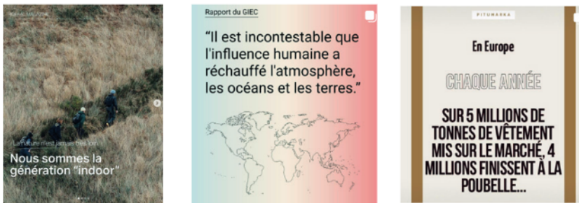
Figure 2. Documentation de l'urgence environnementale

Pour représenter la mode dite responsable, les marques établissent un constat d'urgence environnementale par des publications à vocation « informative » qu'elles distinguent de leurs « posts inspirationnels » (professionnel 3). Les publications « informatives » alimentent et documentent l'urgence environnementale, essentiellement climatique (Campion, 2016) et empruntent les modalités éditoriales de reportages journalistiques, rapports scientifiques ou encore de campagnes d'intérêt public (Fig. 2).