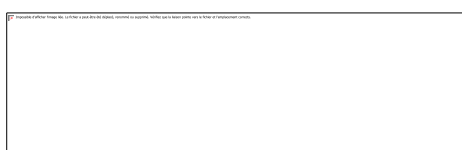
Illustration 3. Exemple sur Facebook d'un profil qui ironise sur une action de communication. Le CM répond, mais cela amène une autre

« Soit c'est un troll [...], soit c'est quelqu'un qui a vécu une très mauvaise expérience en magasin [...]. Et là dans ce deuxième cas, même si le mec est odieux, je peux pas ne pas lui répondre. » (À - Commerce).