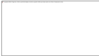
Illustration 6. Exemple d'une réponse à un message agressif sur Twitter.

Cette retenue, que nous mettons en correspondance avec un nécessaire travail émotionnel de surface, peut cependant devenir un facteur de stress ou de fatigue pour ces travailleurs surconnectés et passionnés, ainsi que nous le font remarquer quatre CM interrogés, car « on ne raisonne pas quelqu'un qui est passionné. Ça ne marche pas, donc tu ne dis rien. Donc tu attends que ça passe. Et c'est long. » (M - Sport).