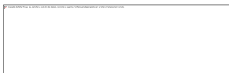
Illustration 3. Exemple sur Facebook d'un profil qui ironise sur une action de communication. Le CM répond, mais cela amène une autre

« Soit c'est un troll [...], soit c'est quelqu'un qui a vécu une très mauvaise expérience en magasin [...]. Et là dans ce deuxième cas, même si le mec est odieux, je peux pas ne pas lui répondre. » (À - Commerce).