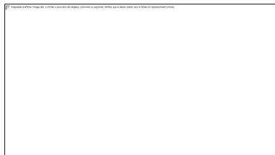
Illustration 6. Exemple d'une réponse à un message agressif sur Twitter.

Cette retenue, que nous mettons en correspondance avec un nécessaire travail émotionnel de surface, peut cependant devenir un facteur de stress ou de fatigue pour ces travailleurs surconnectés et passionnés, ainsi que nous le font remarquer quatre CM interrogés, car « on ne raisonne pas quelqu'un qui est passionné. Ça ne marche pas, donc tu ne dis rien. Donc tu attends que ça passe. Et c'est long. » (M - Sport).